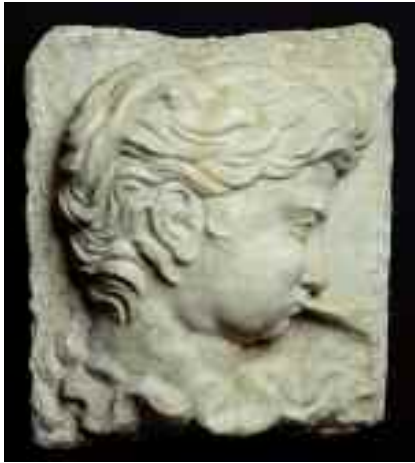
Michelangelo (attribuito), Vento marino o Eolo (1520 circa), Palestrina (Roma), Museo diocesano prenestino di arte sacra.