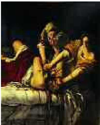
Artemisia Gentileschi, Giuditta che decapita Oloferne (1620), Firenze, Galleria degli Uffizi.