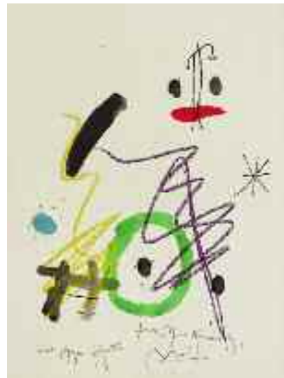
Joan Miró, Qualche fiore per degli amici (1962).

Reperti originali, sculture e mosaici raccontano la millenaria storia del vino, dall'origine della viticoltura nel Vicino Oriente alla sua diffusione in età romana. Articolo p. 18.